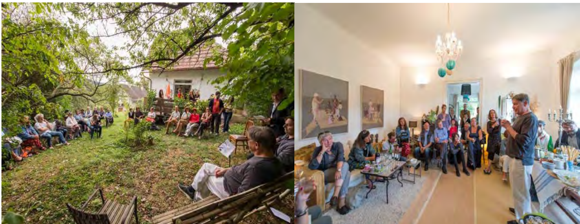
SCHIELEfest NÖ 2015: Lesung Gedichte Egon Schieles und Bilderinstallation Leander Kaiser in Künstlervilla Peter&Eva, Maria Anzbach