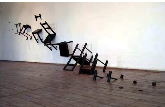
(Werktitel: exit, sesshaft - Installation)