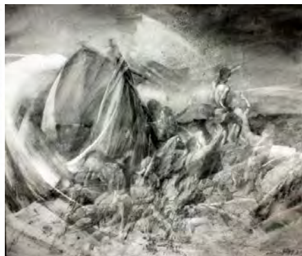
links: Freude schöner Götterfunken (Diptychon, 120 x 180 cm)