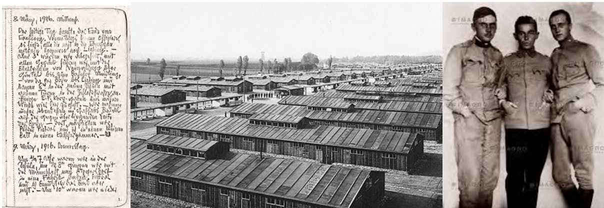
v.r.n.l. eine Seite aus dem Kriegstagebuch 1916, das Lager in Mühling. Schiele als Soldat (Mitte)