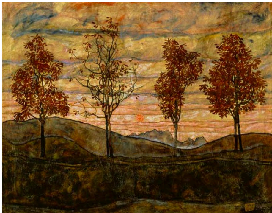
Egon Schiele, Vier Bäume. Kastanienallee im Herbst, 1917, Bebevedere, Wien